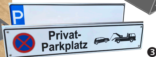
Abb. oben: Anwendungs-Muster Individuelle Schilder bei uns zusätz- lich bestellbar, z.B. hier (Art. U70):